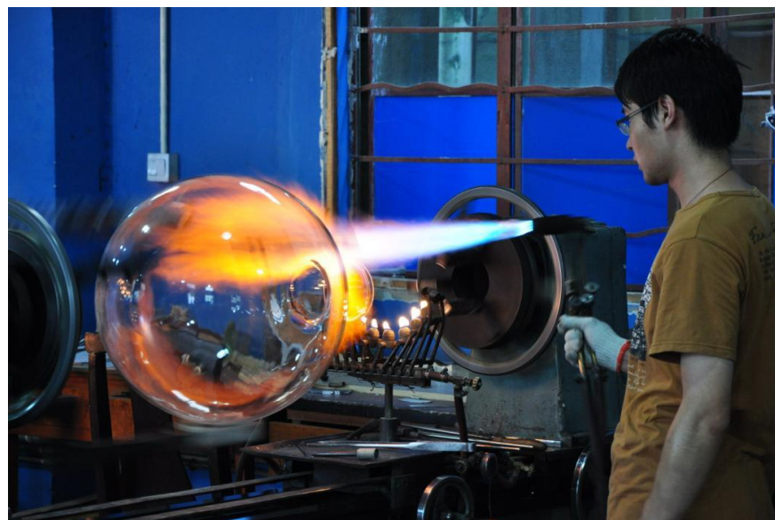
技艺娴熟的玻璃技工