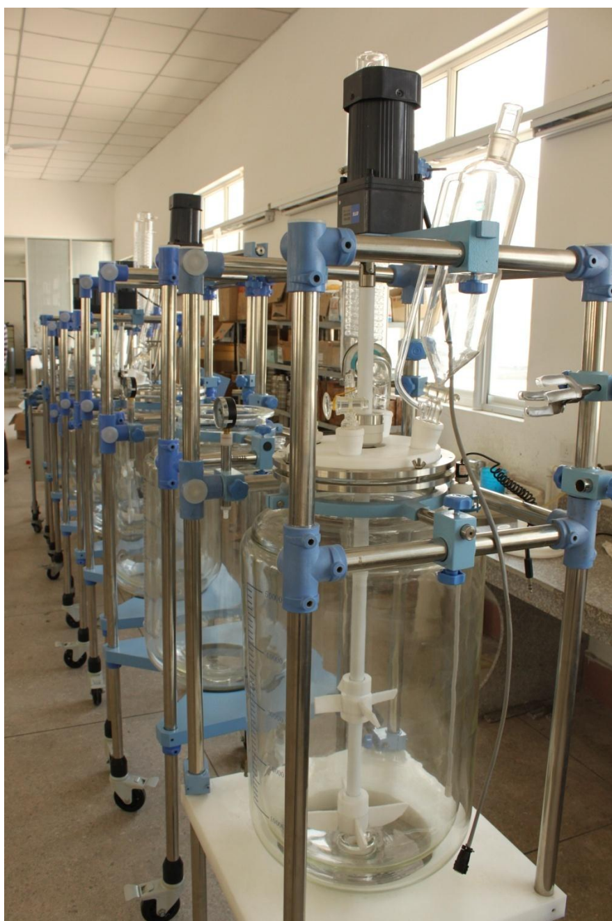
大型双层玻璃反应釜