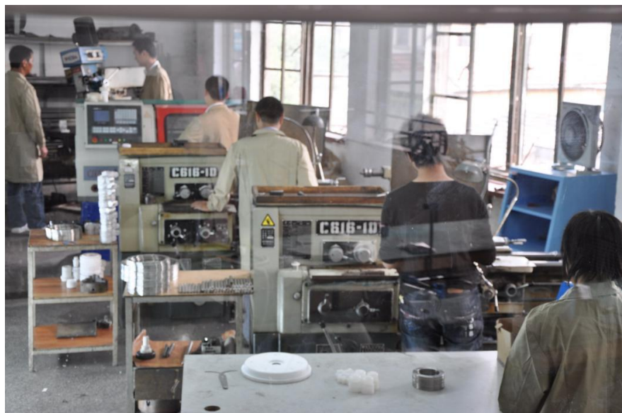
数控机床的精工制造