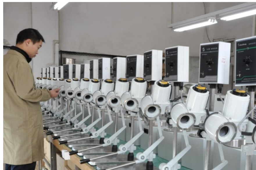
对每台设备均进行严格的出厂检验